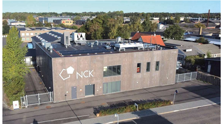
2020年 新パイロット製造設備稼働開始 (1,141m 2 )

デンマークの高薬理活性対応の CMO プロセスの開発、最適化に強み Ph I ~ II のステージに対応 (gm ~ kg)